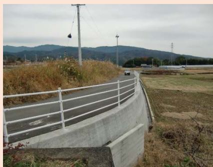
町道土生岡1号線改良工事 (田野町)