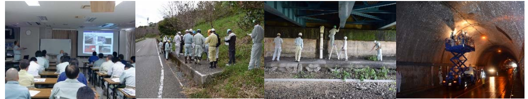
平成28年度の現地研修