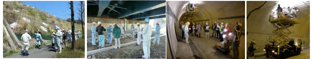
平成29年度の現地研修